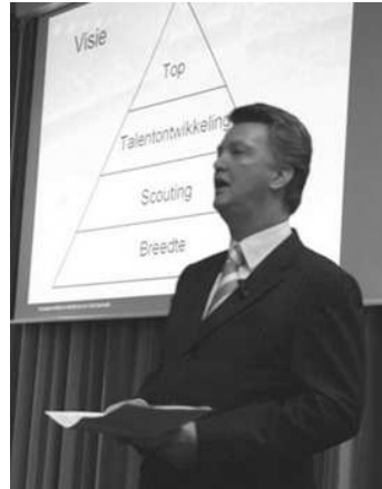
Louis van Gaal