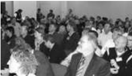
Een goed gevulde zaal bewijst de grote belangstelling voor dit symposium

Met een afvaardiging van 10 personen was ook onze club Be Quick'28 deze middag en avond aanwezig op het sport-complex van de KNVB in Zeist. Om u als clubgenoot te enthousiasmeren en informeren dan ook dit verslag.