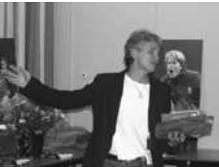
Pia Sundhage, zingt: "you can do it if you really want"

Na Vera Pauw was het de beurt aan Pia Sundhage, ex-recordinternational, Zweeds clubcoach en FIFA-instructeur/ambassadeur. Zij liet haar licht schijnen over de situatie binnen het Zweedse vrouwenvoetbal. En liet daarbij volop merken: waar een wil is, is een weg. Op dit moment trainen zowel Zweedse internationals als nationale competitie- speelsters 8 keer per week, zowel teamtrainingen als individuele trainingen (kracht- en hersteltraining). Volgens Pia is het stellen van doelen door zowel speelster als club erg belangrijk. Haar motto, dat zij zingende aan het publiek ten gehore bracht: "You can do it if you really want, but you will try, try, try ..."